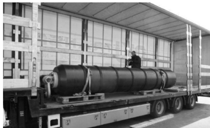
Ziehkopf d 800 SDR7,4 | mit längsseitigen Langlöchern zum Spülen mit Betonit